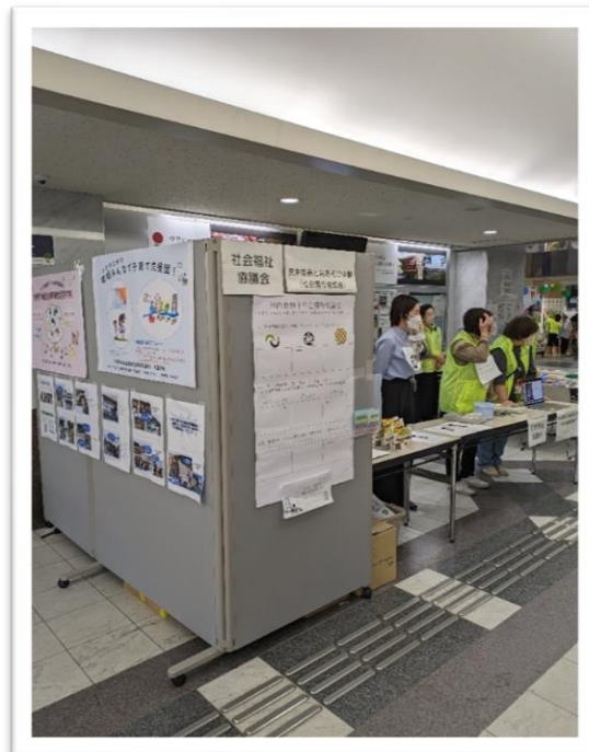
民児協のポスターや社協の活動報告が貼られたパネル

参加した委員の1人は「たくさんのおもちゃたちに すごろく 双六やお手玉を楽しんでもらえてよかったと思います」と感想を述べていました。