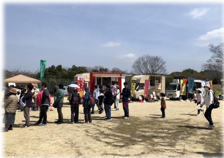
行列をつくる参加者

桜は2分咲きでしたが、たくさんの参加者が集まりウォーキングをスタートしました。桜まつりの会場の第一公園がゴール地点となっており、先着200人にポン菓子プレゼントされました。河南高校の和太鼓部による和太鼓演奏のオープニングで、桜まつりがはじまりました。