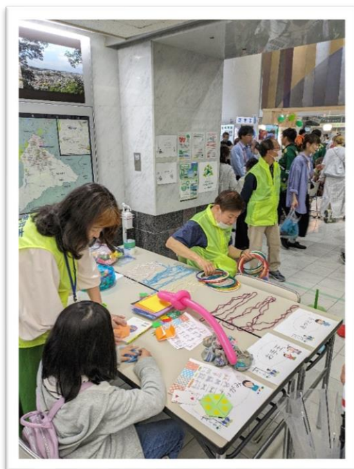
来場した子どもに折り紙を教える委員