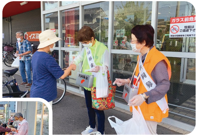
◀ ▲ 「昨年の街頭募金活動」の様子