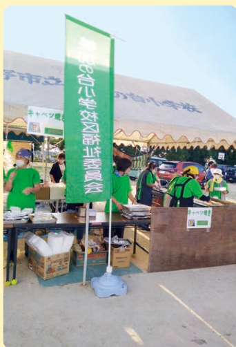
美加の台小学校夏祭り

コロナ禍では、喫茶やカフェ、サロンなどを開催できない日々が続きましたが、今年度からは感染予防対策を行い、少しでも地域の皆様が顔を合わせられる機会を増やしていけるよう、活動していきます。