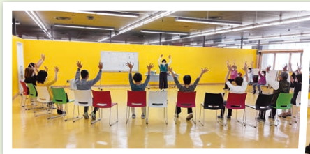
◀◀ 前回の講習会の様子