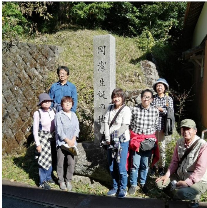
岡潔生誕の地で記念写真