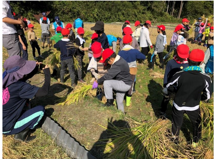
稲藁をしぼる児童

当日刈り取った米は、乾燥・ もみす 糶摺りの工程を経た後、精米をして、5年生が給食で食べる事になっています。