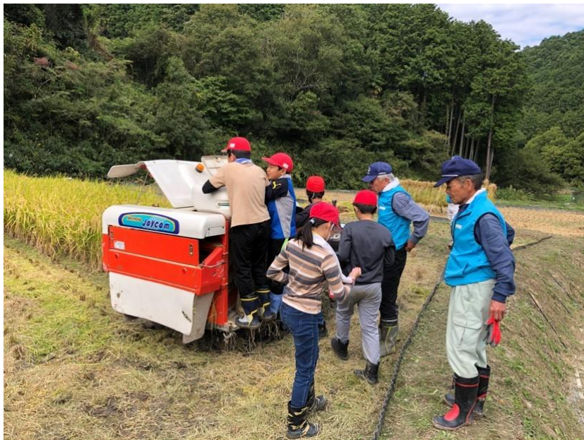
コンバインの説明を聞く児童