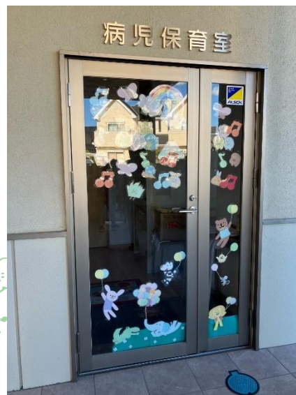
病児保育（生後半年から小6まで）

本年度市教委の委託を受け、4 月からは学童保育事業・病児保育支援（小6まで）が、6 月からは近大病院より言語聴覚士を迎え、療育支援事業がスタートしています。現在、学童保育には 30 人、療育支援事業には市内の保育園・幼稚園・小学校より 10 人の子どもたちが登園しています。