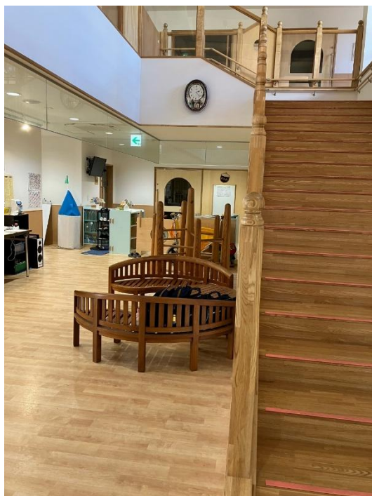
工夫が凝らされた園舎内

当園では、通常の保育の他に延長保育、一時預かり保育、障がい児保育、病児保育、地域子育て支援拠点事業、学童保育一時預かりなどの事業が行われています。