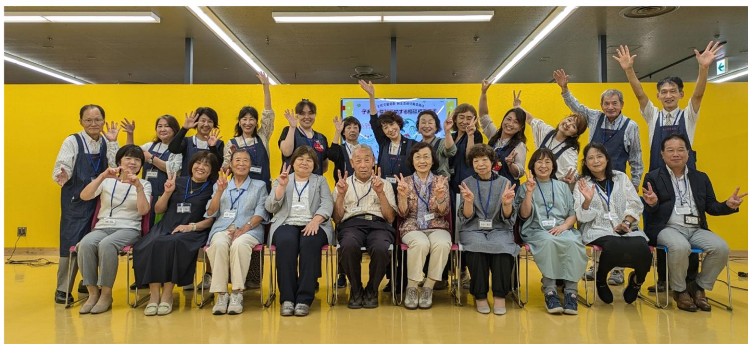
楽しかった時間を体で表現する参加者たち

昼食時、参加者たちは懐かしい映像を見て当時を思い出したり、新しくできた主任児童委員の PR 動画のメイキングの裏話を聞いたりして、交流を深めました。