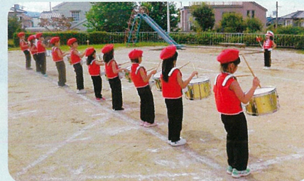
運動会鼓笛演技の練習の様子

それぞれの施設が連携し“チーム河内長野”で共生のまちづくりに取り組んでいければと思っています。