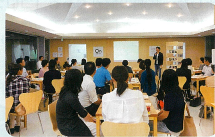
様々な方が交流する“まちづくりイベント”の様子(オンキッチンにて)

めくもり On Kitchen ★ 社会福祉協議会 (イズミヤ河内長野店4階) ★ 天宗清見台園