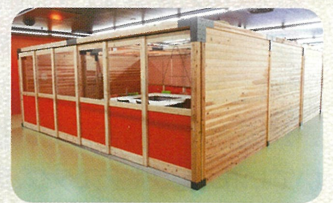
▲小多目的スペースA