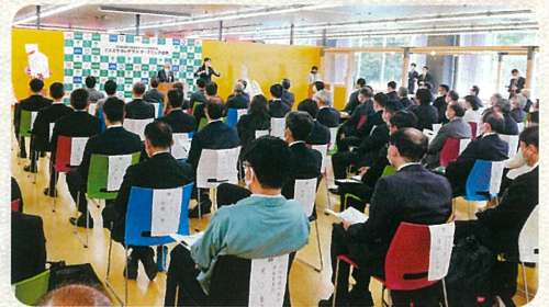
▲オープニング式典の様子