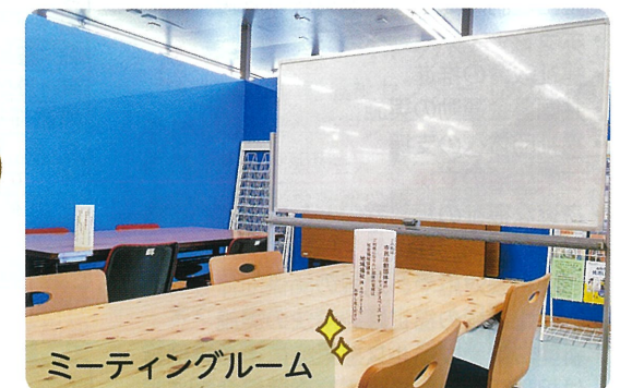
ミーティングルーム