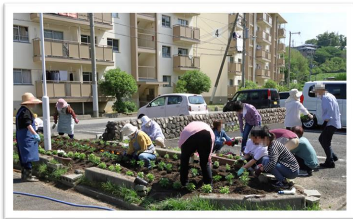
和気あいの植えつけ作業をする参加者たち

参加者のひとは「同じところに住んでいても棟や階が違ったりすると会うことも少ないので、いろいろな人とお話ができるのがいいですね」と語っていました。