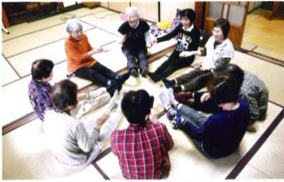
輪になってお手玉を使って歌体操ゲーム

地域の居場所・輪づくりや、市民の社会参加や健康維持増進を目的とした集い「げんきやday」が昨年10月28日から始ま