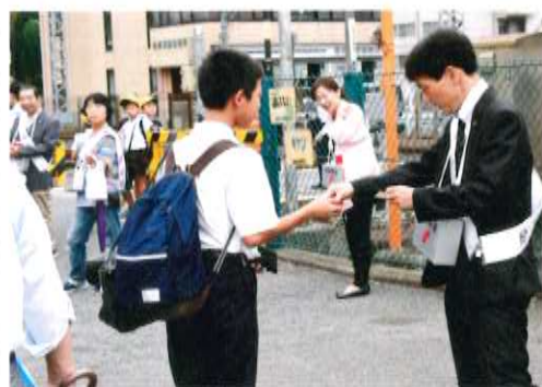
河内長野駅前での街頭募金の様子