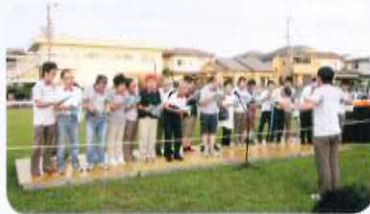
音楽クラブ発表の様子

成人の知的障がいを持った方の入所施設です。「みんなの笑顔が幸せ運ぶ」をスローガンに、利用者一人ひとりの障がい程度をしっかりと把握し、個別に応じた対応を心がけています。