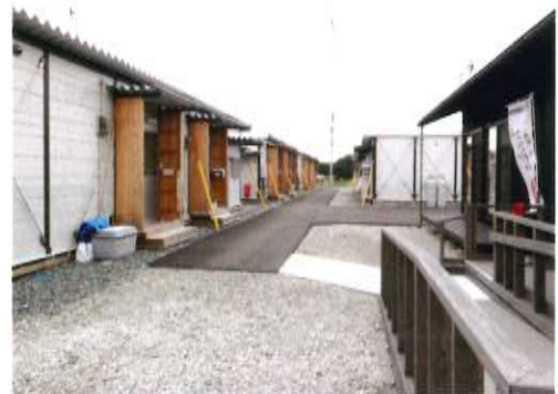
新たに建設された仮設住宅(左)と集会所(右)

談やお困りごとへの対応を行うほか、集会所でのサロン活動などのコミュニティ・交流の場づくりのお手伝いをしています。