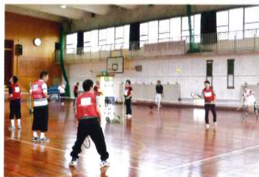
体育館には、名前を呼ぶ声や黄色いボールを追いかける足音が響いています

になり、道端で会うと挨拶をするようになりました。活動中は一人ひとりの障がいの状況や特性に応じて関わっています。例えば、球出しをする時は名前を呼びながら打ちます。名前を呼んで反応してくれると、こちらも自然と笑顔になります。他にも支援者が元気をもらう場面は多々あり、毎回活動に来るのが楽しみです。