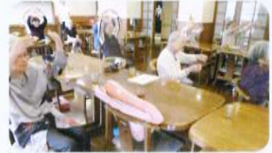
毎日健康体操をしています

お食事のついた高齢者向けマンションタイプの社会福祉施設です。60歳以上で自立している方が対象ですが、介護保険施設としてサービス