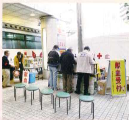
ノパティながでの献血の様子

※日程、時間に変更になる可能性もありますので予めご了承ください。 ※輸血時の安全性を高めるため400mL献血のみ実施します。