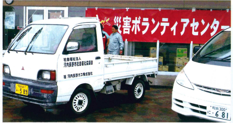
大津町災害ボランティアセンター前で、活動の出番を待つ本会の軽トラック

また、全国社会福祉協議会近畿ブロック社協の一員として、5/22～26日、6/15～19日にかけて職員を派遣しました。