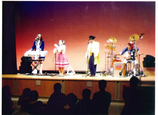
父母の会 ファミリーコンサート