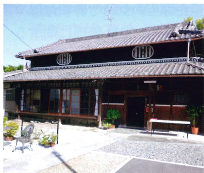
古民家「市町 Diary」 外觀

社会福祉法人 河内長野市社会福祉協議会 〒586-0041 河内長野市大師町26-1 TEL (0721)65-0133(代表) FAX (0721)65-0143