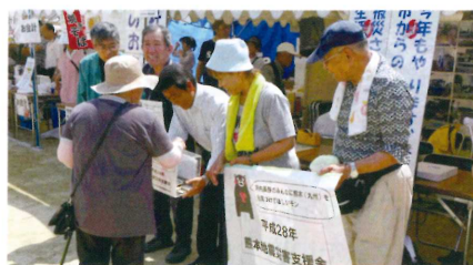
温かいお気持ち、ありがとうございました。

市内15地区（校区）の福祉委員会の啓発を目的に活動のパネル掲示、4月に発災した「平成28年熊本地震」のパネル掲示、宮城県岩沼市と南三陸町の復興紹介パネル掲示、模擬店を実施しました。 また、「平成28年熊本地震災害支援金」の募金箱を設置し、福祉委員の皆さんの呼び込みにより12万6千5百7円のご協力を得る事が出来ました。これら全ては、被災地の社協を通じて、被災者支援活動に使用させていただきます。