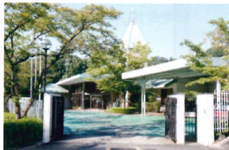
園の周りは自然に囲まれていて緑がたくさんあります。

今以上に地域とつながり、さらに充実していきたいです。昨年実施した交流会など、つながる機会が他にもあればいいと思います。