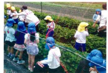
しょうとく園園児と一緒にイチゴ狩りをしました。

施設間のつながりをもっと強めたいです。河内長野独自の特徴あるシステム作りが必要だと思うので、チャレンジ精神で色々取り組みたいと思います。