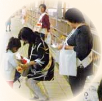
昨年の 街頭募金の様子