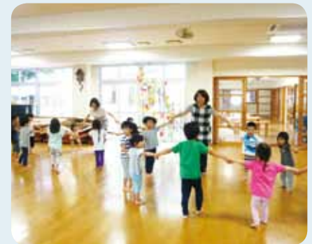
手をつないでリズム遊びをしています

また、通園されていない地域の親子の方々のために月2回子育て支援も行っています。給食の試食会では、家とはまた違う様子が見られると好評です。