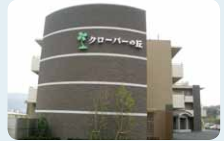
高台にあるので、景色が良いです

また、日頃から喫茶や踊り、書道など様々なボランティアさんを受入れています。職員ができること以外の部分を補ってくださっています。職員はボランティアさんともコミュニケーションをとるように意識し、ボランティアさんの声や想いを伺っています。そうする事で、職員では気づかない点に気づかされたりもしています。