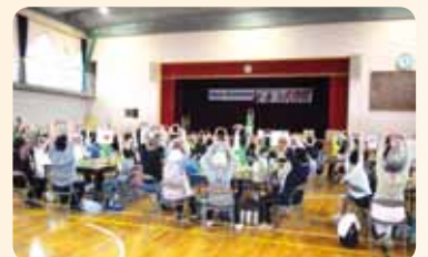
福祉委員会による子どもと高齢者を対象にした全体サロン (福祉委員会活動は2ページ下段にも掲載しています)