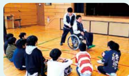
車いすの操作方法を説明している様子