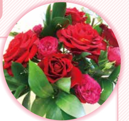
フラワーアレンジメント教室の作品